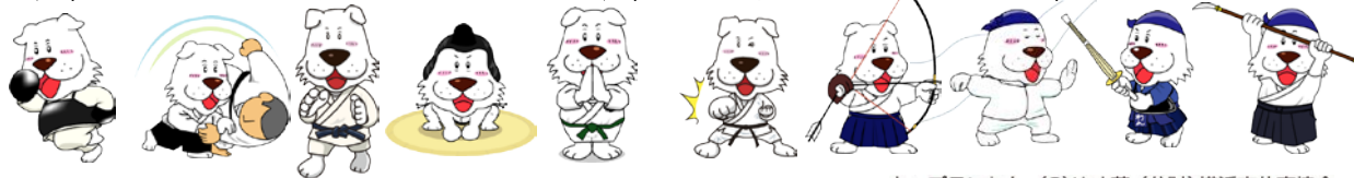
キャプテンわん (C)ゆず華・(公財)横浜市体育協会