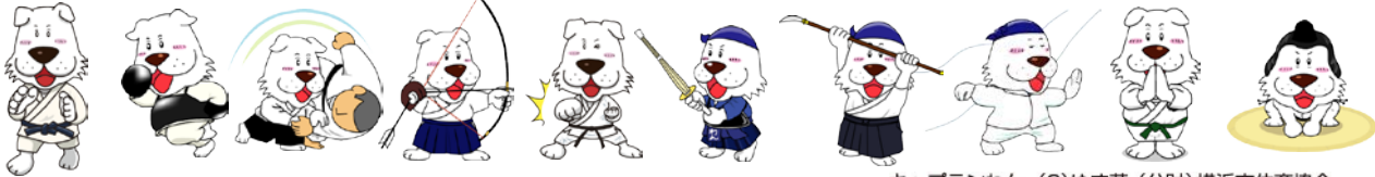
キャプテンわん (C)ゆず華・(公財)横浜市体育協会