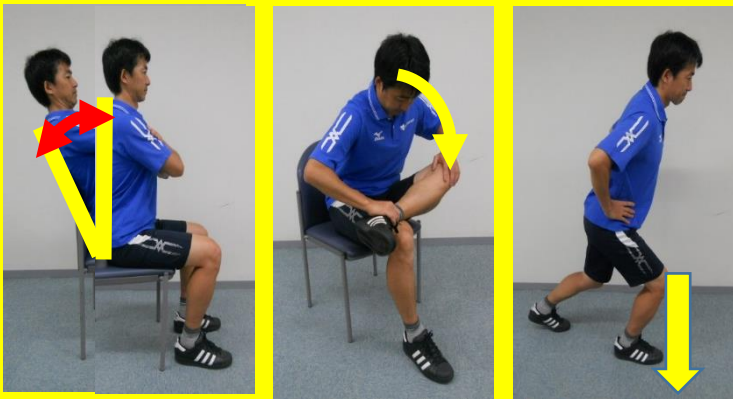
股関節伸展制限の改善運動基本例

今回はその「姿勢改善運動」をテーマに 姿勢改善の指導方法、動きの実践と応用できる運動を紹介する ワークショップ講座を開催します。